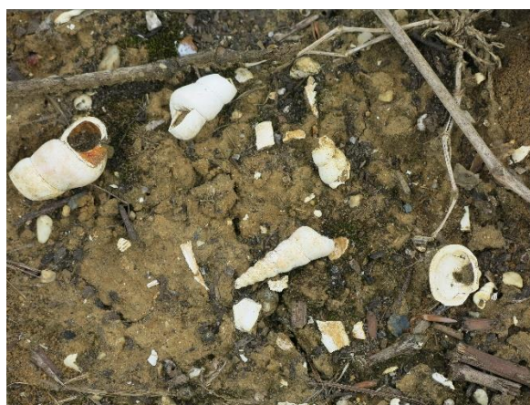
...aux fossiles de 19 millions d'années