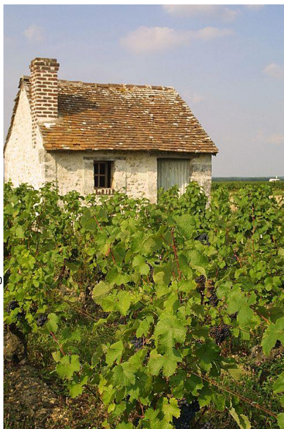
Une loge de vigne

La situation et les dimensions de l'AOP Coteaux du Vendômois lui permettent de rester à l'écart des phénomènes de mondialisation et de banalisation du vin que ses instances tiennent à considérer comme un produit culturel. L'histoire de la région ainsi que la proximité des châteaux de la Loire les confortent dans cette idée !