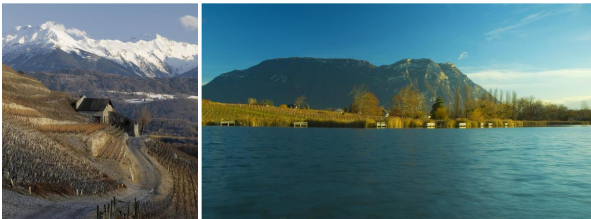
La vigne, la montagne et l'eau

Elle s'est également établie sur le versant occidental de la montagne du Chat (Marestel, Monthoux, Jongieux) et de la Cluse de Chambéry (Monterminod, St Jeoire Prieuré, Chignin, Chignin Bergeron, Apremont et Abymes qui déborde sur l'Isère). Enfin, les dénominations géographiques Montmélian, Arbin, Cruet et St Jean de la Porte bénéficient d'une exposition sud-est sur la rive droite de la Combe de Savoie.