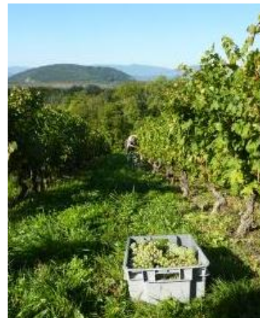
Vendanges du Crémant en Chautagne

Depuis quelques années des vignerons avaient choisi d'élaborer leurs effervescents selon le cahier des charges Crémant. Les premiers vins montrent un style très actuel : des notes de fruits blancs et d'agrumes, de la fraîcheur, des dosages précis et limités pour l'élégance et la finesse. Les consommateurs vont pouvoir découvrir ces Crémants dès Noël 2015, la mise en marché ayant lieu après une période d'élevage de 12 mois minimum. Cette mention Crémant de Savoie est un véritable atout pour la région : le potentiel de développement commercial est réel, en particulier à l'export.